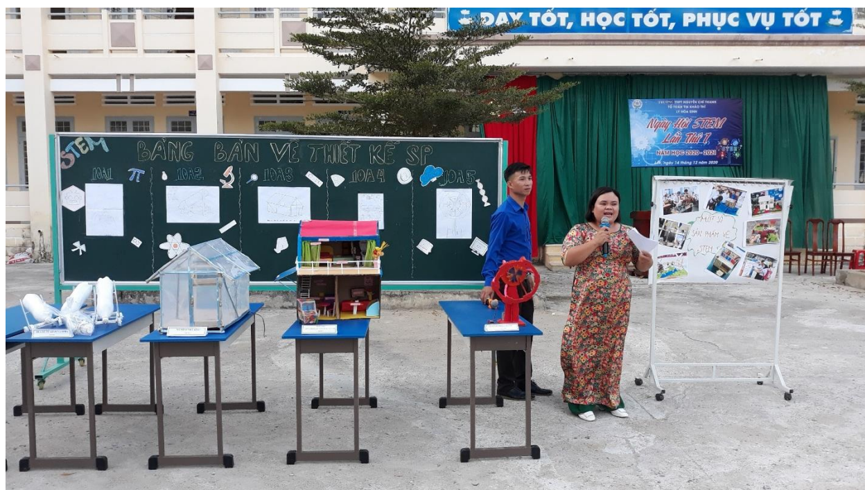
Phần thi: Tìm hiểu về Stem.

Ở phần thi “Tìm hiểu về STEM”, các đội chơi được lắng nghe các kiến thức chung, trả lời một số câu hỏi về STEM. Phần thi nhằm giúp cho học sinh hiểu rõ hơn về STEM và bước để tạo ra một sản phẩm STEM.