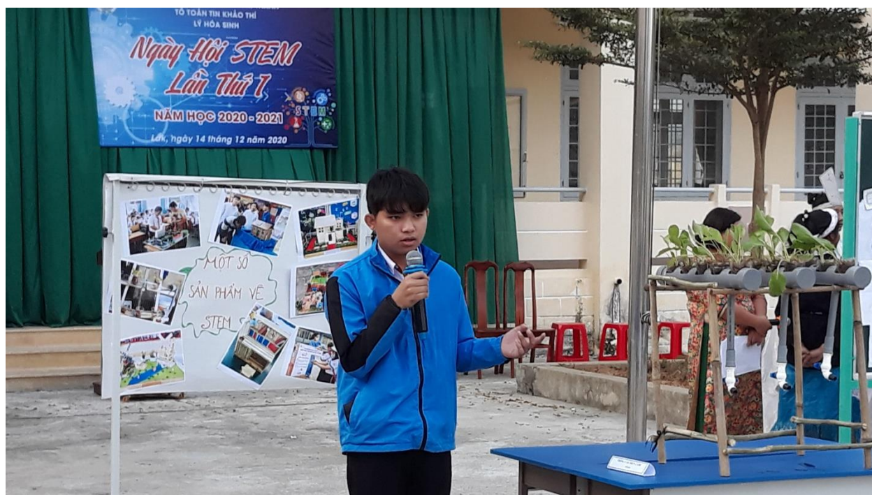
Mô hình trồng cây thủy canh của lớp 12A1.