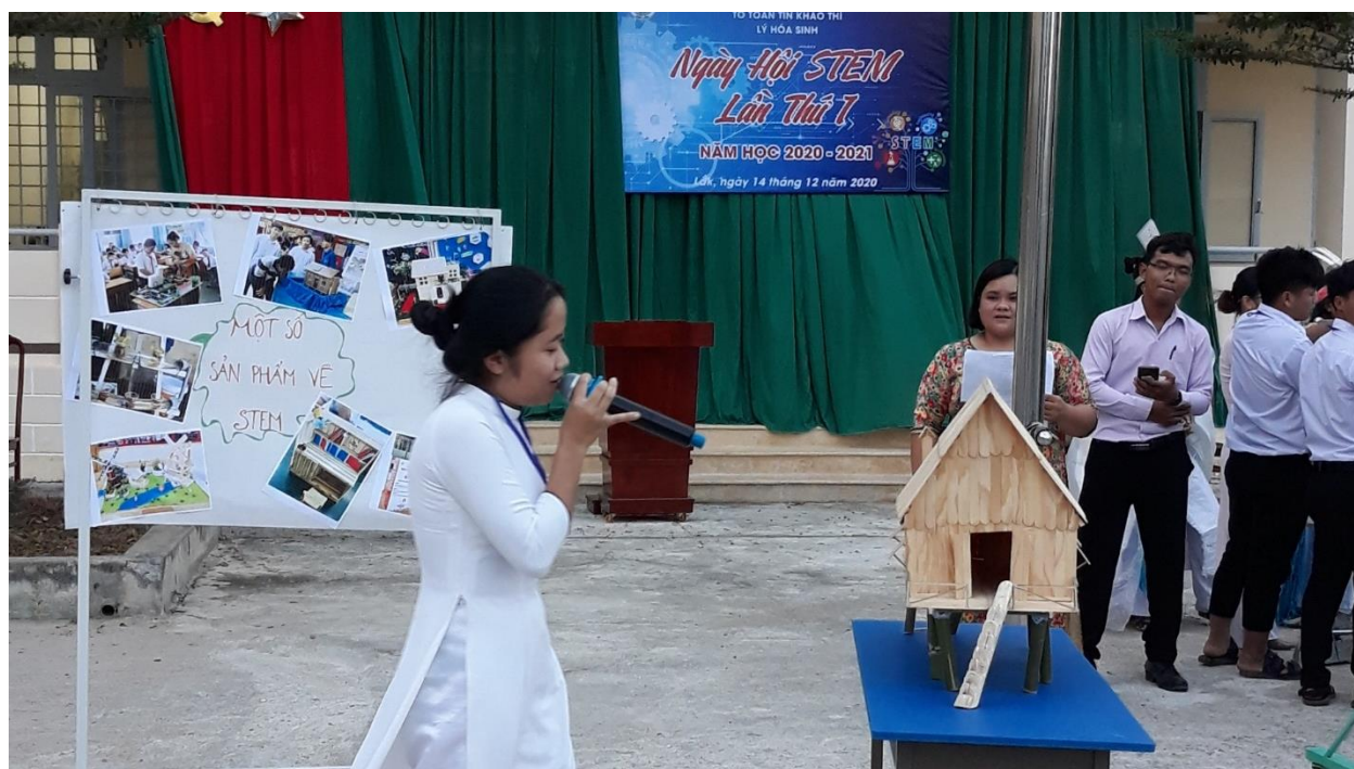
Mô hình nhà sàn Tây Nguyên làm từ tre, trúc, gỗ,... đến từ lớp 12A3.