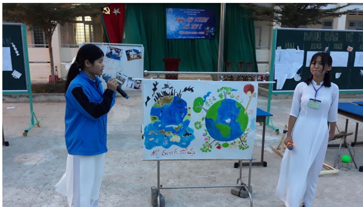
Bức tranh mang thông điệp bảo vệ môi trường "No Earth, no life" của lớp 11A3.