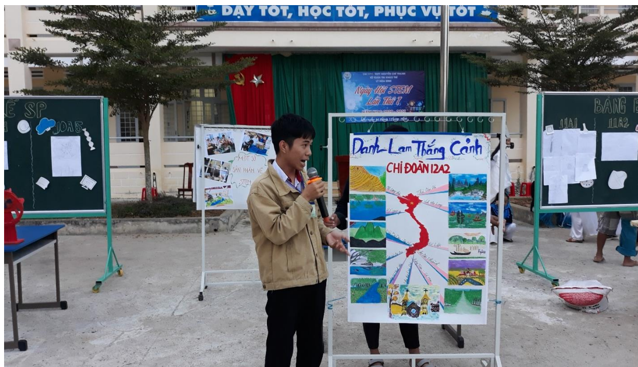
Hình ảnh về các danh lam thắng cảnh của lớp 12A2.