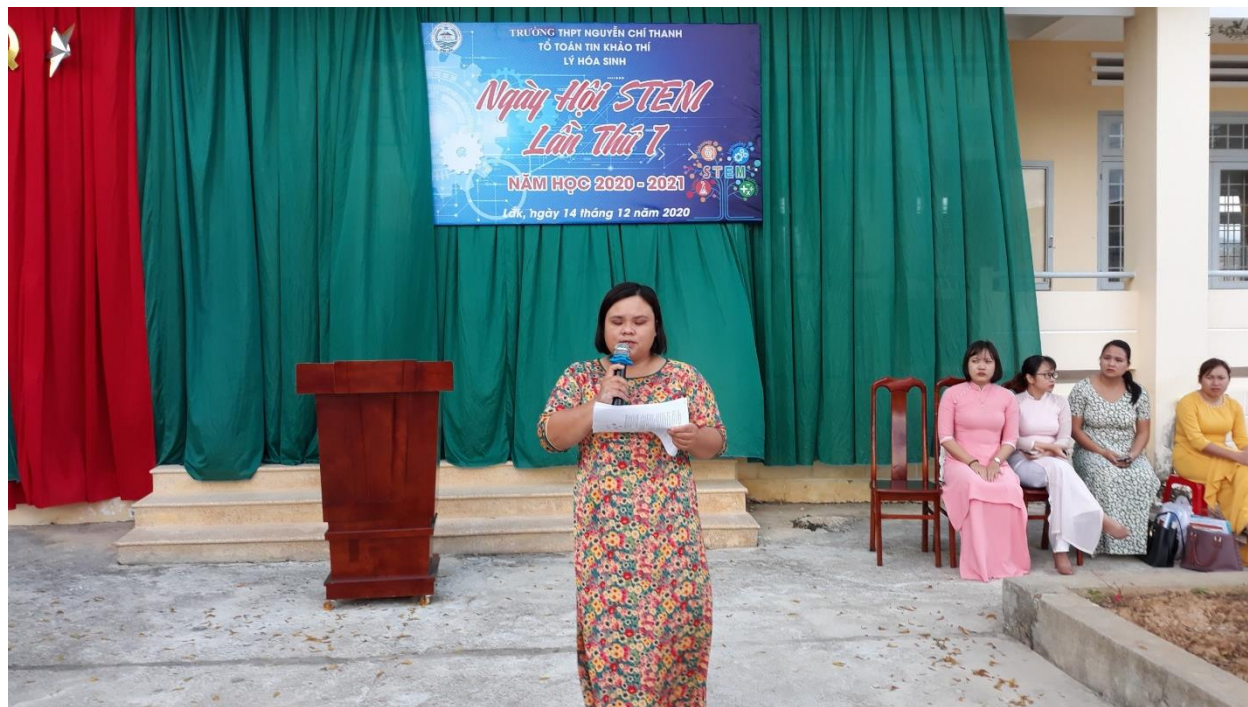
Một số hình ảnh trong ngày hội STEM.