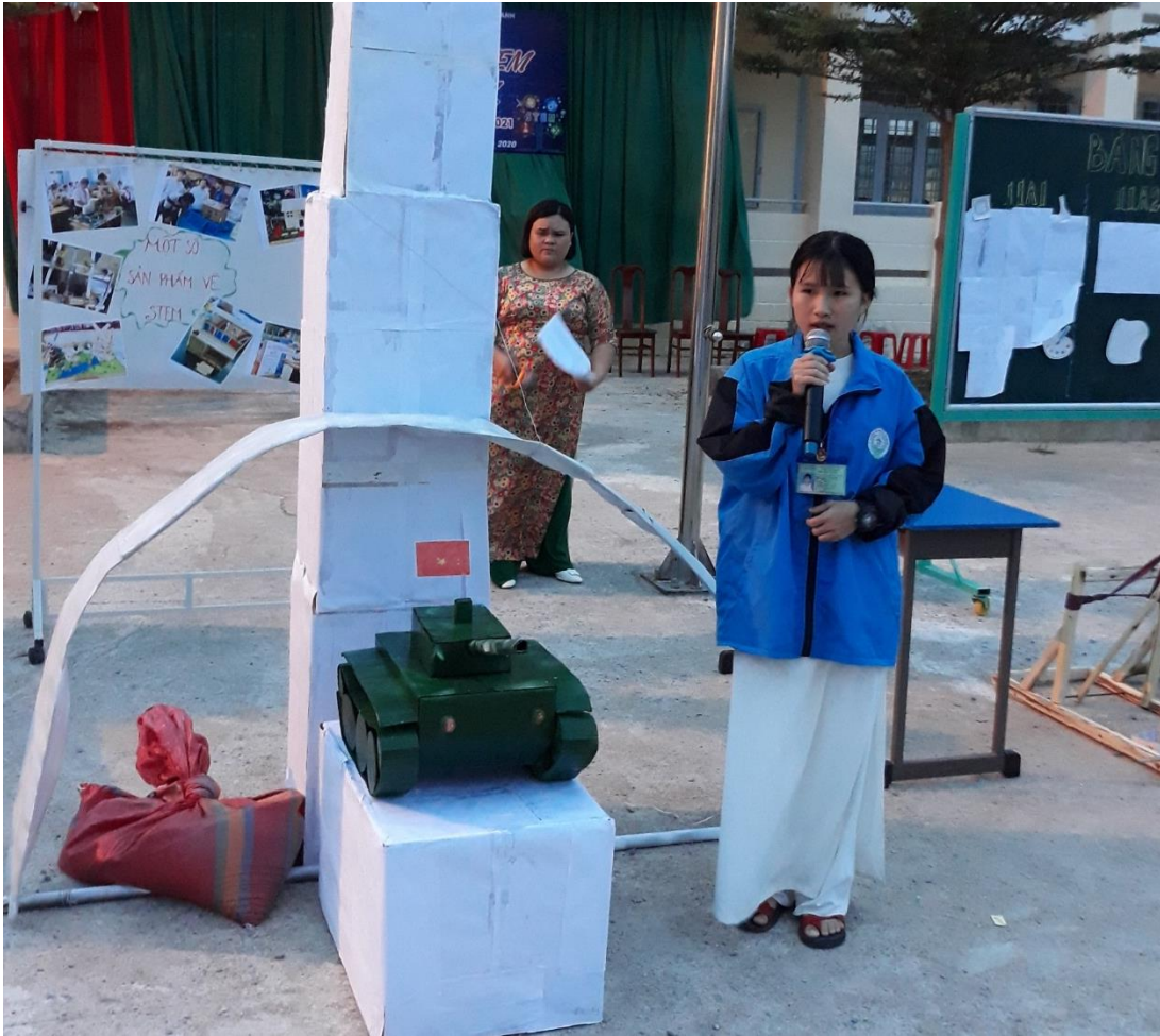
Mô hình xe tăng mô phỏng theo ngà sáu thành phố Buôn Ma Thuột của lớp 10A1.

Cuối cùng, các em học sinh được quan, trải nghiệm các sản phẩm của các đội chơi.