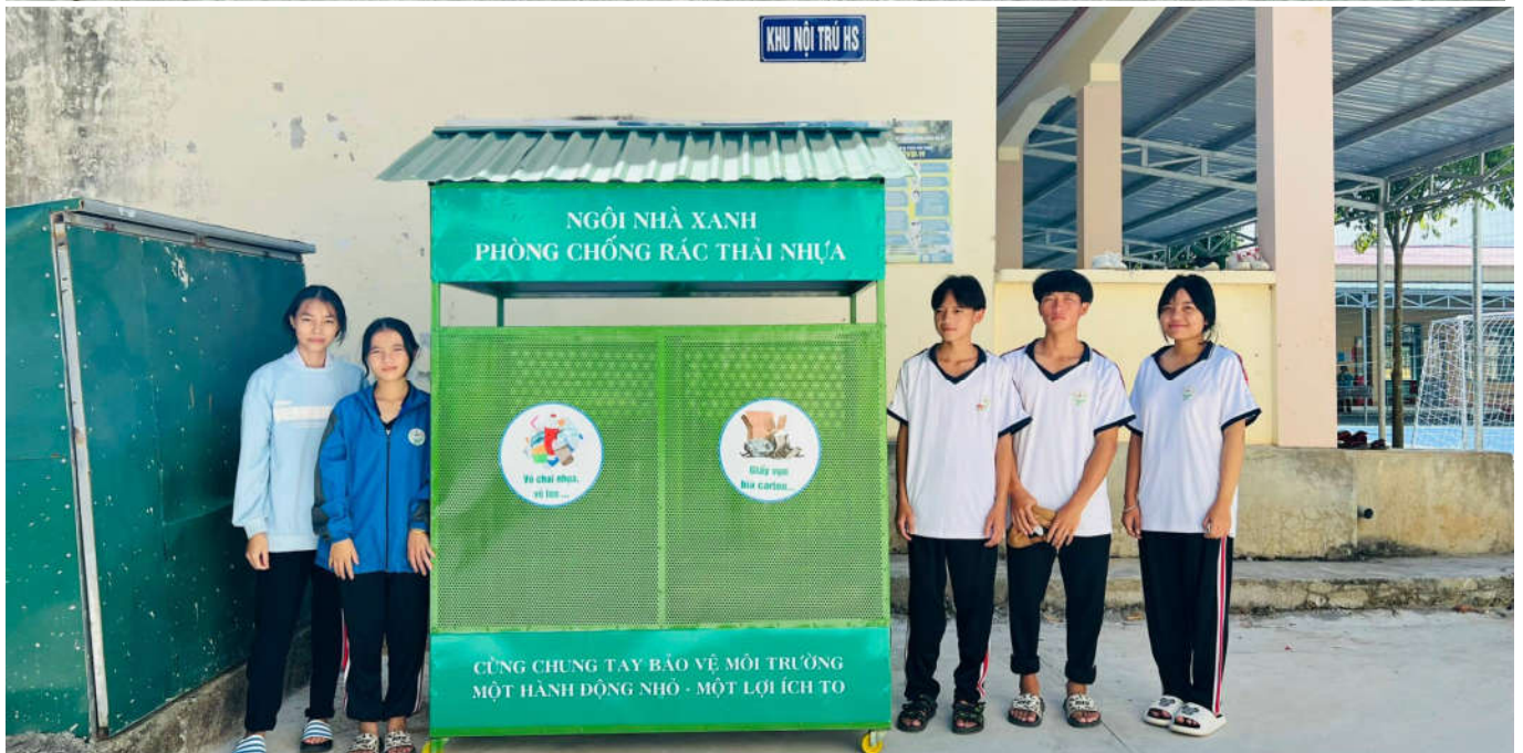
Đoàn trường THPT Nguyễn Chí Thanh tiến hành bàn giao 03 “Ngôi nhà xanh – phòng chống rác thải nhựa” và đưa vào sử dụng từ ngày 07/11/2022.

Bên cạnh đó Đoàn trường THPT Nguyễn Chí Thanh cũng triển khai nhiều hoạt động thi đua sôi nổi khác hướng về chủ đề “Tôn sư trọng đạo” của tháng 11 với nhiều hình thức như Phong trào thi đua về học tập “hoa điểm tốt”, “tiết học tốt”, “tuần học tốt” . Các em thi đua thực hiện nghiêm túc nội quy nề nếp, thực hiện nếp sống văn minh giữ gìn cảnh quan môi trường xanh, sạch, đẹp... Sau khi phát động phong trào nhận được sự hưởng ứng tích cực của tất cả các chi đoàn với 440 hoa điểm tốt, 160 tiết học tốt. Phong trào đã khích lệ tinh thần thi đua thân thiện, tích cực trong học tập và rèn luyện, đồng thời là những đóa hoa vô cùng ý nghĩa dâng lên quý Thầy Cô giáo nhân ngày Nhà giáo Việt Nam.