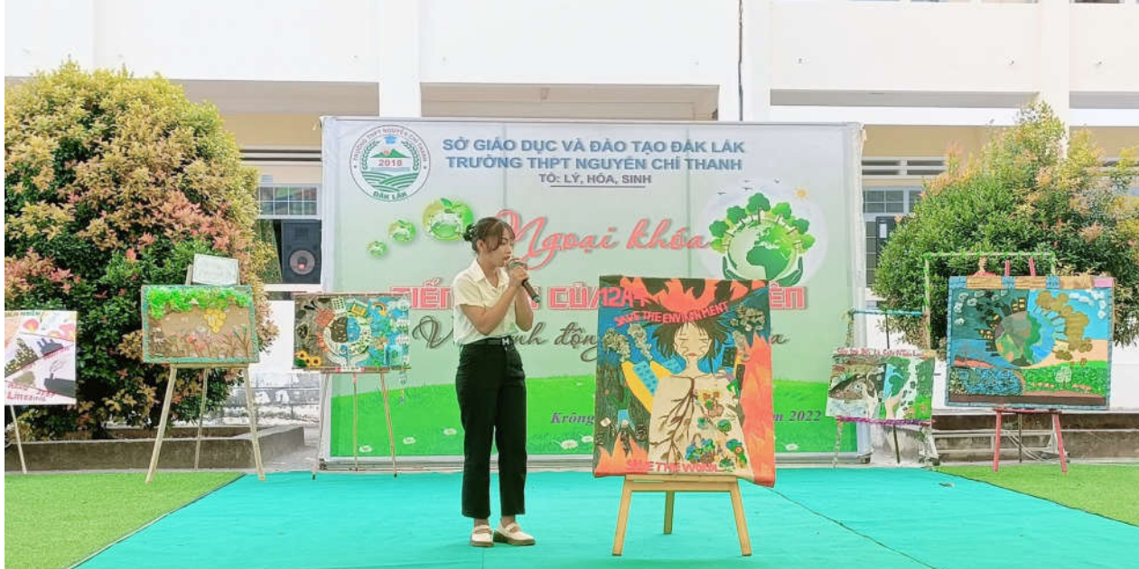
Các tập thể lớp thuyết trình về tranh do lớp mình vẽ.